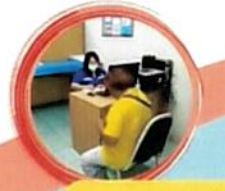
ตรวจรักษาโรคทั่วไป