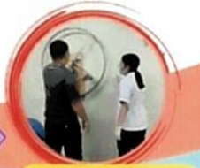
กายภาพบำบัด

บริการสุขภาพอื่นๆ วันจันทร์ - ศุกร์ 08.30 - 16.30 น. ยกเว้นวันหยุดราชการและวันหยุดนักขัตฤกษ์