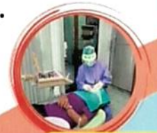
คลินิกทันตกรรม