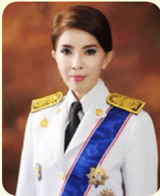
นางพัชราภรณ์ อินทริยงค์ ปลัดสำนักนายกรัฐมนตรี