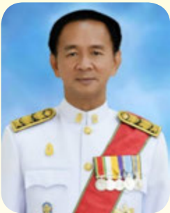
นายการุณ สกุลประดิษฐ์ ปลัดกระทรวงศึกษาธิการ