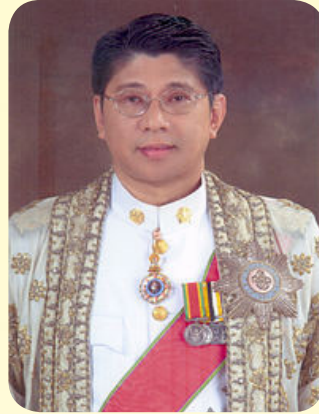
นายวิษณุ เครืองาม รองนายกรัฐมนตรี

ประธานกรรมการ การกระจายอำนาจให้แก่ องค์กรปกครองส่วนท้องถิ่น