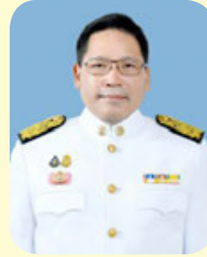
นายอุตตม สาวนายน รัฐมนตรีว่าการกระทรวงการคลัง