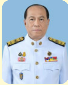
พลเอก อนุพงษ์ เผ่าจินดา รัฐมนตรีว่าการกระทรวงมหาดไทย