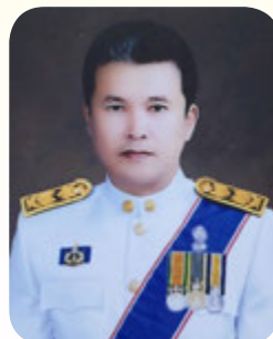
นายสุทธิพงษ์ จุลเจริญ อธิบดีกรมส่งเสริมการปกครองท้องถิ่น