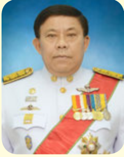
พลตำรวจเอก อัครวิน ขวัญเมือง ผู้ว่าราชการกรุงเทพมหานคร