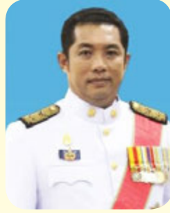
นายสนรยา คุณปลื้ม นายกเมืองพัทยา จังหวัดชลบุรี