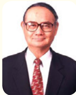
ศาสตราจารย์พิเศษสมชัย ฤชุพันธุ์