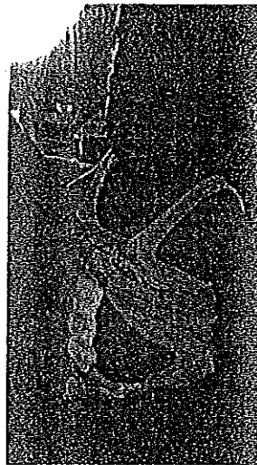
ภาพที่ ๓ แผลจากการผ่าตัดของ ด.ญ. ณัฐนิชา ทะพินรำ