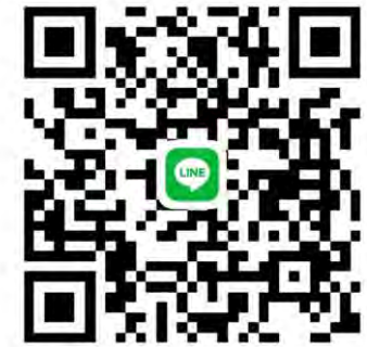
ศพด. โรงเรียนวัดโพธิ์บ้านอ้อย(ทองดีวิทยานุสรณ์)

หมายเหตุ - ผู้ปกครองต้องจัดหา ชุดกีฬา, เสื้ออนุรักษ์ไทย, เครื่องแบบเด็กเล็ก