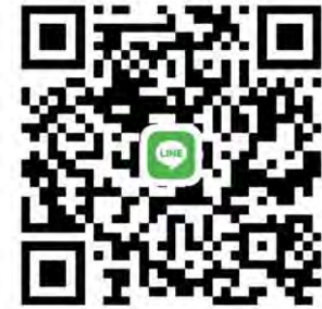
ศพด.รร.วัดบางพูดใน(นนทวิทยา)

หมายเหตุ - ผู้ปกครองต้องจัดหา ชุดกีฬา, เสื้ออนุรักษ์ไทย, เครื่องแบบเด็กเล็ก